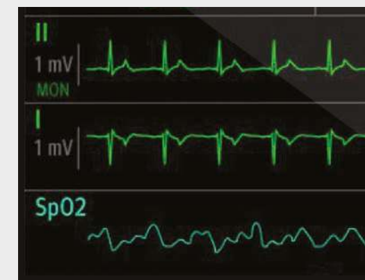
Anpassbare Darstellung der Kurven