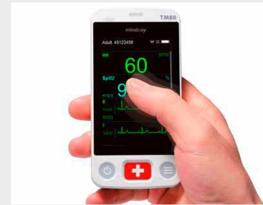
Leichte Handhabung wie bei einem Handy dank des 3,5-Zoll-Displays