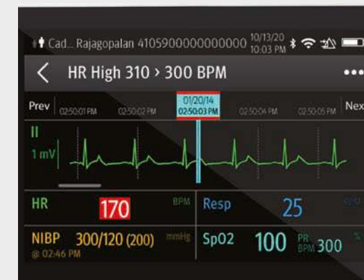
EKG-Trends und -Ereignisse auf dem TM80 überprüfen