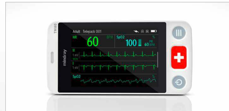
Der weltweit leichteste Telemetrie-Monitor hat ein 3,5 Zoll großes Touchscreen-Display.

Der BeneVision TM80 überzeugt als intelligente und innovative Monitoring-Lösung. Das mobile High-end-Produkt von Mindray ist klein, leistungsstark, mobil und einfach in der Handhabung. Jedes Detail des TM80 ist so konzipiert, dass es gehobenen klinischen Anforderungen gerecht wird und perfekt mit der entsprechenden Zentrale kommuniziert. Dank dieser Ergänzung zur Bene-Vision-Serie gelingt eine effizientere Behandlung ambulanter Patienten – nicht per Funk, sondern innerhalb eines drahtlosen Netzwerkes. Der BeneVision TM80 verfügt über die grundlegenden Funktionalitäten eines Monitors und den Komfort eines Smartphones mit integrierter Bluetooth- und WiFi-Funktion. Er ist eine clevere Ergänzung der Monitoring-Geräte von Mindray, die den Zeitgeist trifft und die Flexibilität im Klinikalltag deutlich erhöht.