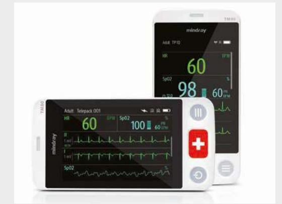
Einfach abzulesende Anzeige in der horizontalen und vertikalen Ansicht