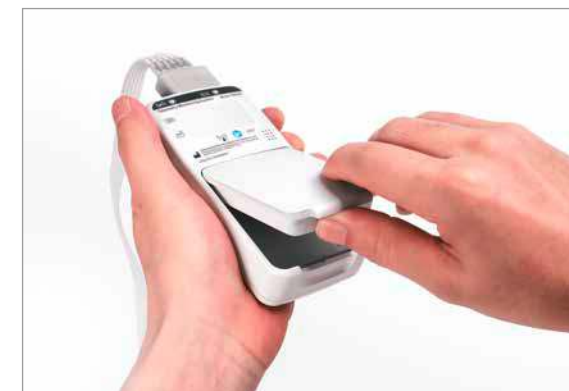
Austausch des Akkus in nur einem Schritt

Verwendung auf lange Sicht deutlich günstiger ist. Um die Betriebszeit zu verlängern, kommt ein Energiesparmodus zum Einsatz, der den Bildschirm schwärzt und den BeneVision TM80 dennoch in ständiger Bereitschaft hält. Der aktuelle Ladezustand wird im komfortablen Display permanent angezeigt.